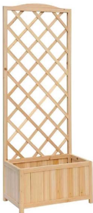
Figura 5: Fioriera in legno