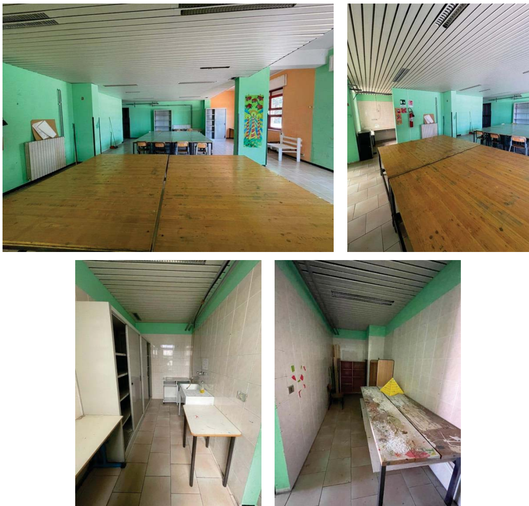
Figura 2: Foto dei locali del laboratorio oggetto dell'intervento (stato di fatto)