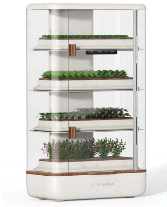
Figura 6: SerraCHEF prodotto da Serranova