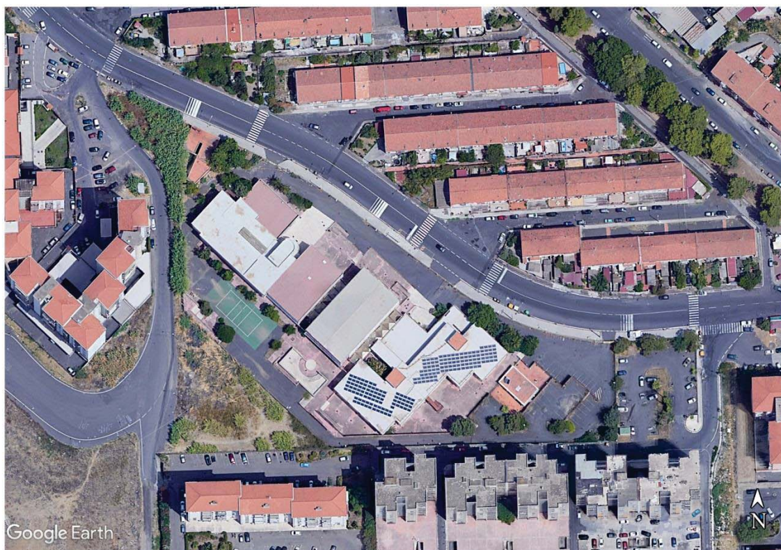
Figura 1: I.O.S. "Pestalozzi" - Sede Succursale in Viale Nitta n. 11 Villaggio Sant'Agata (CT)

altre aule didattiche, servizi igienici, il laboratorio di informatica, il laboratorio d'arte, il laboratorio di scienze e la terrazza. Il lotto di terreno occupato dall'edificio scolastico è delimitato da muri di recinzione che lo separano dal viale Nitta. (cfr. Figura 1).