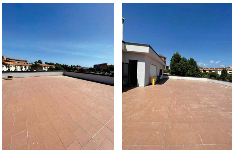
Figura 3: Foto della terrazza oggetto dell'intervento (stato di fatto)